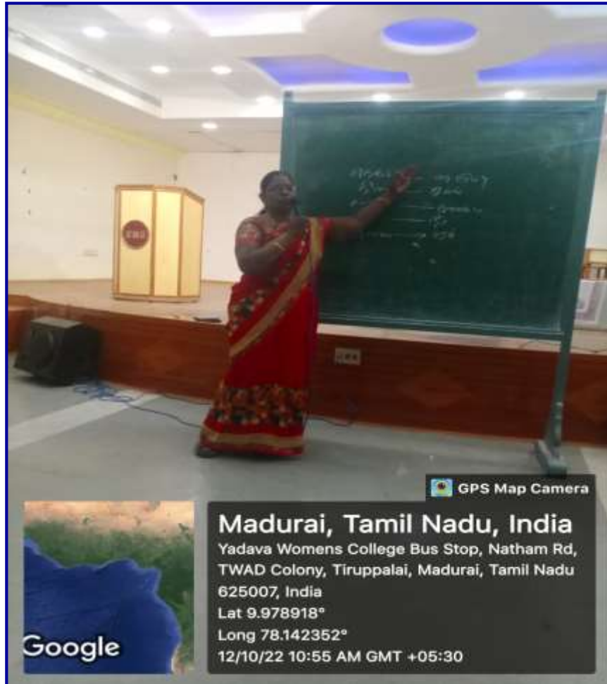
Seminar on "Panchaboothangalum Utalamaipum" - 12.10.2022