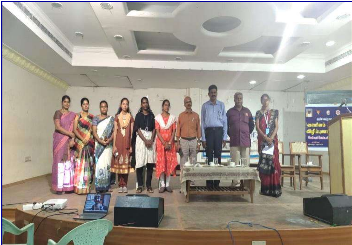
NSS team of EMGYWC organized a Seminar entitled "Awareness Programme on Early Pregnancy" on 26.09.2023