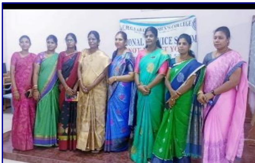
The NSS Team of EMGYWC organized a Seminar on "ValaithalaAdimaithanam" on 28.10.2022